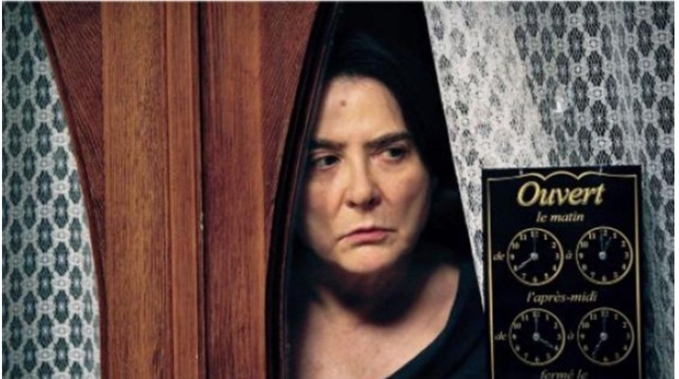
Josiane Balasko dans le rôle d'une concierge dans «L'Élégance du hérisson».